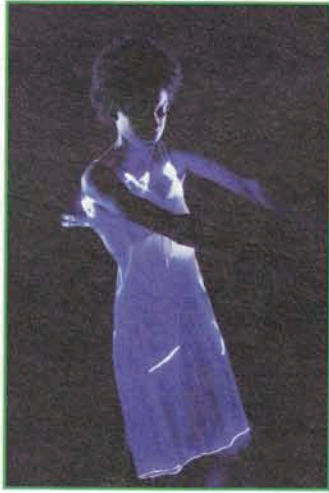
◀ ▼ Video Spin Cycle with Luminex Dresses 2008, stills